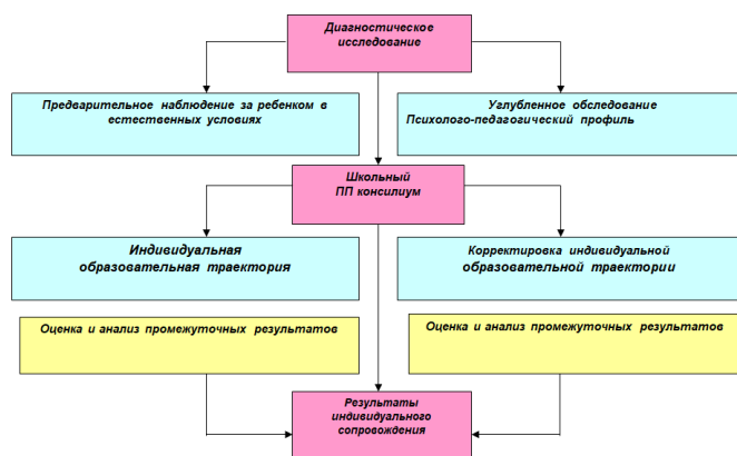
Рисунок 2. Схема взаимодействия педагогов и специалистов

2. Социальное партнёрство - взаимодействие педагогов и специалистов на уровне общеобразовательного учреждения с другими организациями на основе договоров и соглашений о сотрудничестве по решению вопросов образования, охраны здоровья, социальной защиты и поддержки учащихся. Взаимодействие осуществляется со следующими организациями: